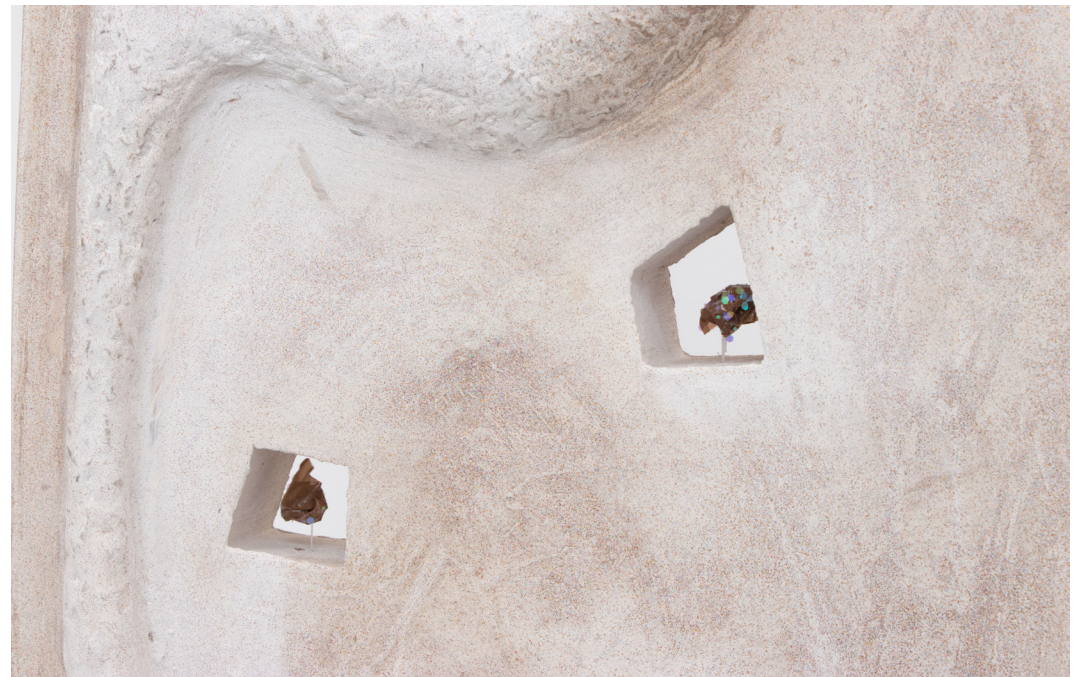
Grande pailletée à goutte

contreplaqué, OSB, pin, carton, enduit, paillettes, mécanismes d'horloge, scotch, quincaillerie, 167x54x40cm, 2025